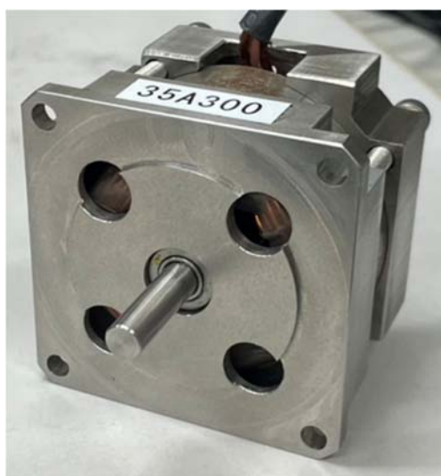
図 2. 強磁性窒化鉄ボンド磁石を用いたモータ